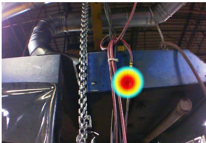
Изображения выполнены акустическим устройством визуализации для промышленного применения ii900.

Fluke. Keeping your world up and running.®