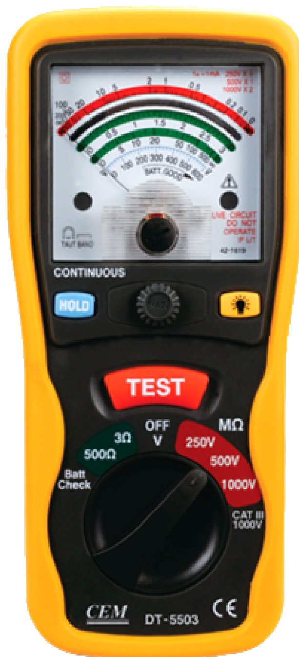
DT – 5503