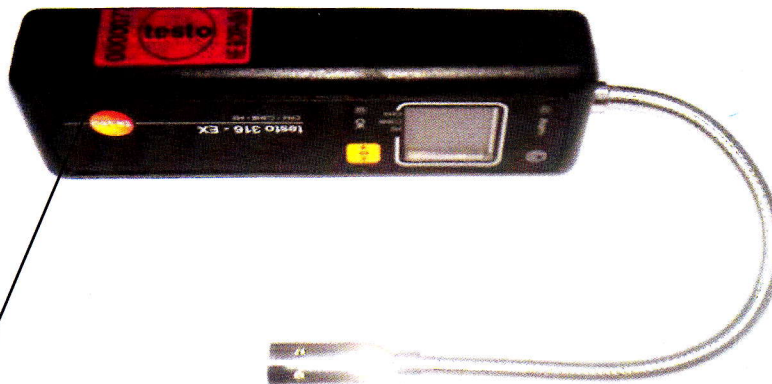
Защитная разрушающаяся наклейка-пломба

Стык двух частей корпуса защищен разрушающейся при вскрытии наклейкой с надписью «testo» (рис. 2).