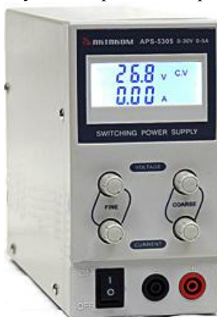
Рисунок 1. Фотография общего вида источников питания.

Фотография общего вида источников питания представлена на рис. 1. Схема пломбировки от несанкционированного доступа изображена на рис. 2.